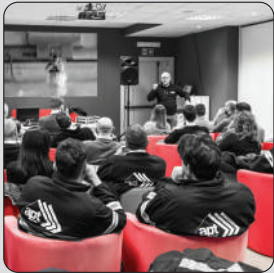
FORMAZIONE & ADDESTRAMENTO