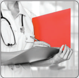
MEDICINA DEL LAVORO