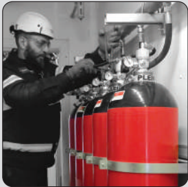
IMPIANTI & MANUTENZIONE