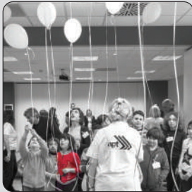
SAFETY GAMES IDEAS